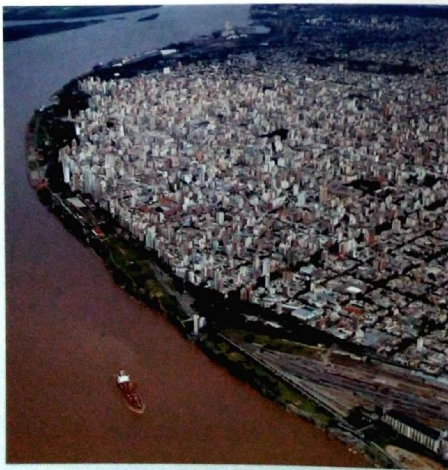
Rosario, Santa Fe

Construyendo plataformas que permitan administrar de forma concertada los conflictos y oportunidades de las economías de aglomeración, atendiendo particularmente a la planificación de los sistemas y redes cuyo manejo supone responsabilidades compartidas entre distintos niveles de gobierno tales como las cuencas hídricas, el transporte y la movilidad y el tratamiento y disposición final de residuos, entre otros.