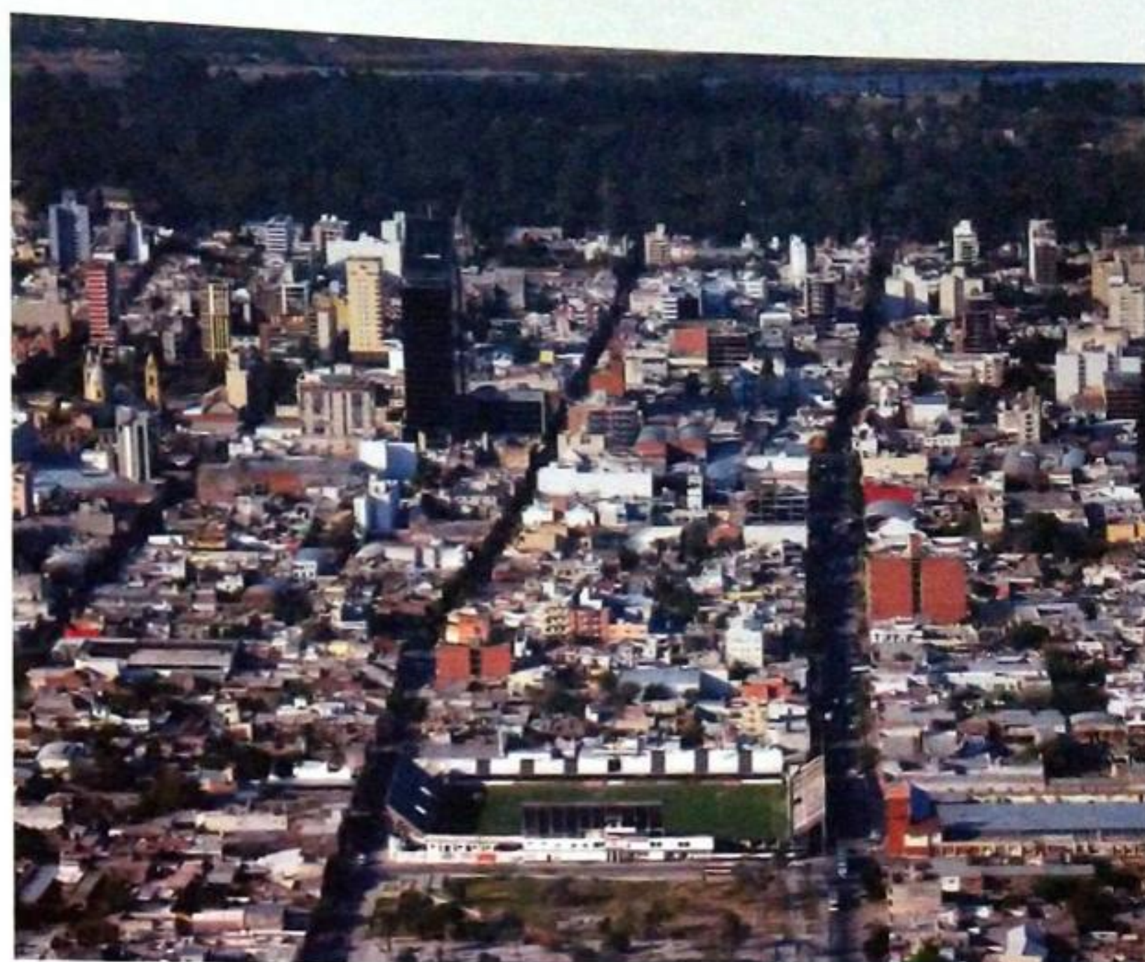
Ciudad de Tucumán

• Complementando marcos regulatorios metropolitanos. Actualizando de forma complementaria y sistemática los códigos de ordenamiento territorial de las entidades administrativas involucradas en los procesos de conurbación, enmarcados en planes estratégicos territoriales que asignan superficies de usos