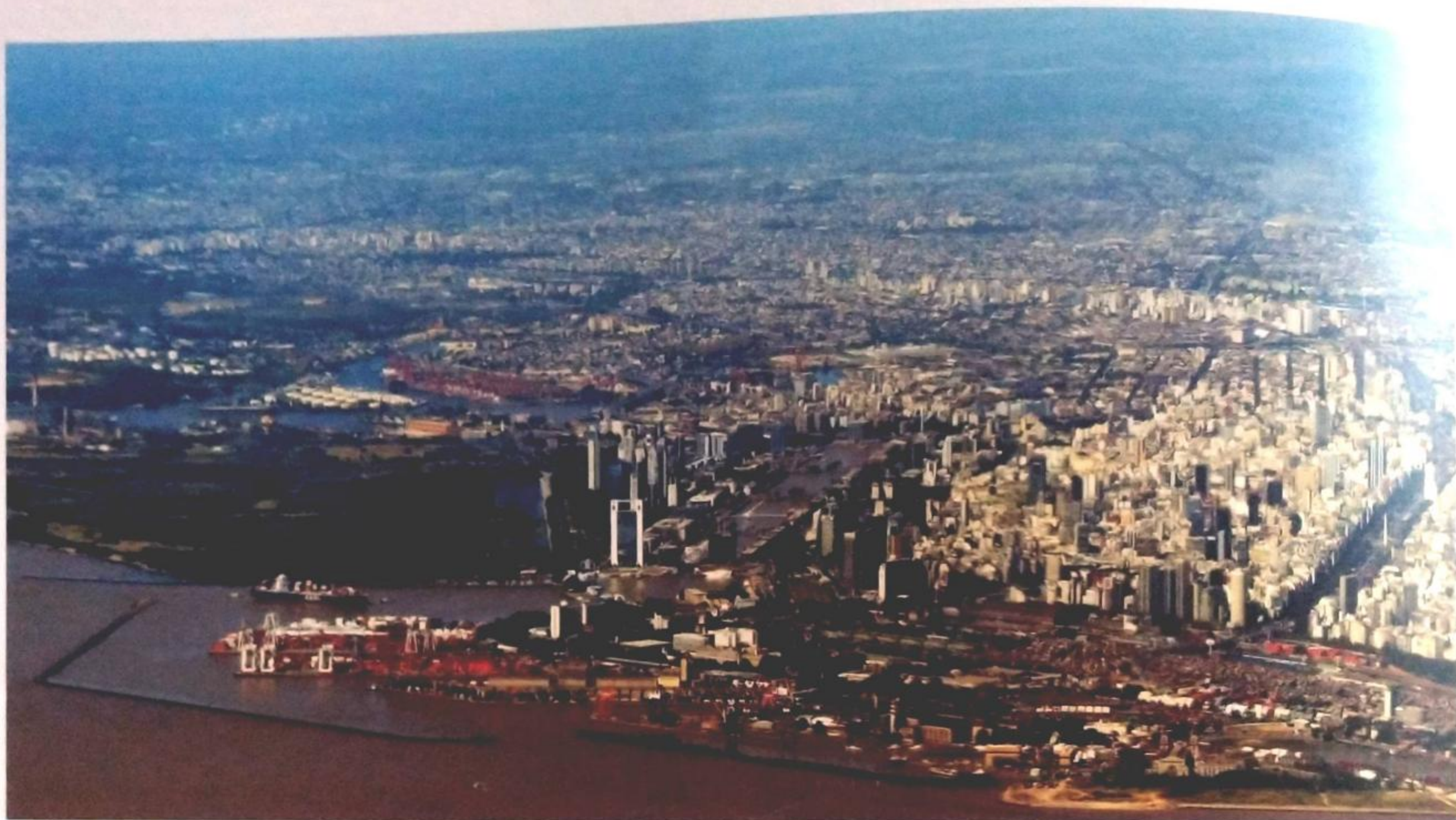
Ciudad de Buenos Aires