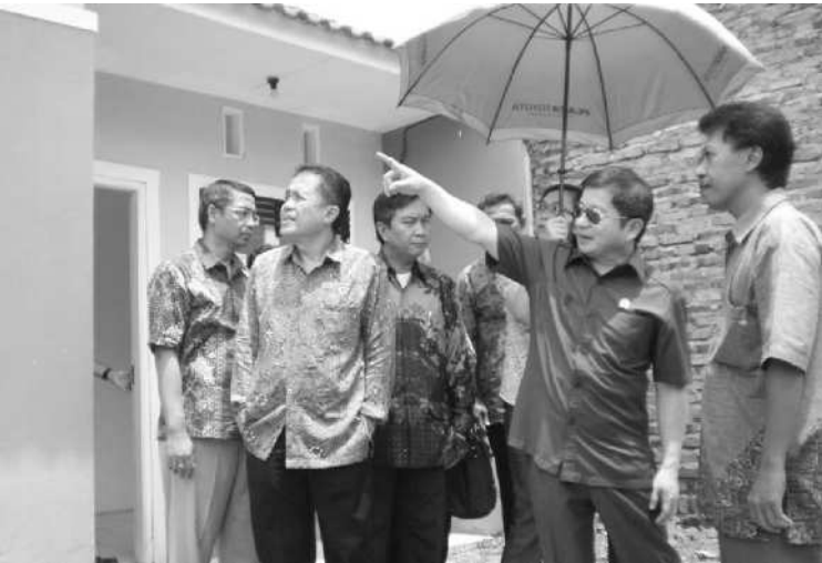
TINJAU LOKASI: Menpera Suharso Monoarfa saat meninjau perumahan sehat sederhana (RSH) di Karawang, Jawa Barat.

Sedangkan pengembang tetap akan dikenakan pajak penghasilan (PPh) final sebesar satu per-