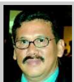
Oleh: ILHAM BINTANG

ras wartawan menyiarkan berita seperti itu. Dalam bahasa di newsroom, berita itu belum lengkap. Atau bahasa hukumnya, sumir. Apapun alasannya, karena dikejar deadline kantor atau takut didahului kompetitor. Apalagi kalau tujuannya sekedar gagah-gagahan belaka, tidak bisa ditolerir.