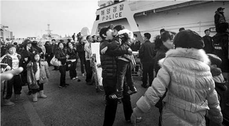
BERPELUKAN: Seorang ayah baru bertemu dan menciumi anaknya yang baru keluar dari kapal di pelabuhan Incheon, Korsel. Mereka menumpang kapal berbeda saat berangkat dari Pulau Yeonpyeong, kemarin.

Obama dibangunkan dari tidur sekitar pukul empat pagi Selasa waktu setempat untuk menerima