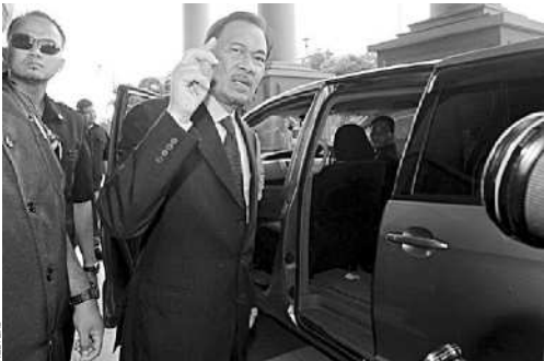
DIADILI LAGI: Anwar Ibrahim berbicara kepada asistennya, sebelum meninggalkan pengadilan, di Kuala Lumpur, Senin (22/11).

“Saya ingin menekankan pernyataan Presiden Mahmoud Ahmadinejad bahwa kami tak mengenal batas dalam pengembangan hubungan dengan Indonesia. Indonesia adalah negara besar dan memiliki peran penting dalam penyelesaian isu internasional. Hal itu dibuktikan dengan keberadaan Sekretariat ASEAN di Jakarta dan peran aktif Indonesia dalam forum internasional. Indonesia juga memiliki peran penting dalam transfer energi dunia dari Teluk Persia ke Asia Timur dan menjadi pintu masuk ke ASEAN,” tandasnya. ■ EFL