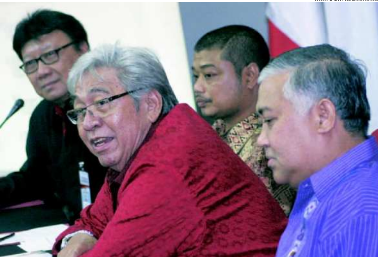
GANDENG DIN: Ketua MPR Taufik Kiemas bersama Ketua Umum PP Muhammadiyah Din Syamsuddin saat diskusi empat pilar berbangsa yang diadakan di kantor DPP PDIP Perjuangan, Jakarta Selatan, kemarin.