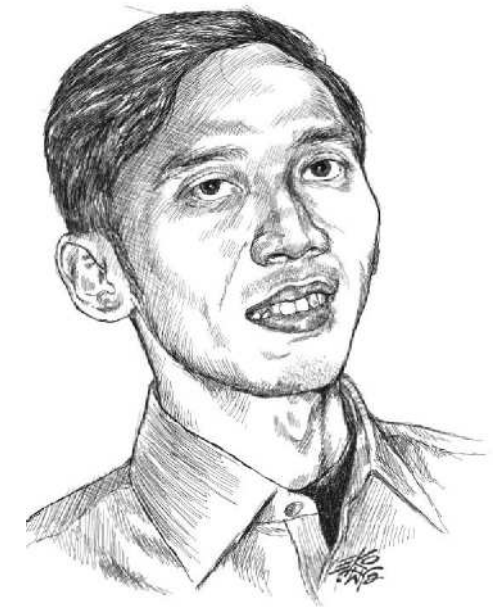
Pemerintah hendaknya mendesak aparat hukum Arab Saudi agar menghukum seberat-beratnya pelaku pembunuhan dan penganiayaan TKI.

“Keadilan bagi warga kita yang dianiaya di luar negeri hendaknya kita perjuangkan. Pemerintah perlu mendesak Arab Saudi agar pelaku pembunuhan dan penganiayaan TKI dihukum seberat-beratnya,” ujar Sekjen Partai Demokrat, Edhie Baskoro Yudhoyono, kepada Rakyat Merdeka , di Jakarta, kemarin.