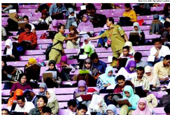
TES CPNS: Ribuan peserta tes Calon Pegawai Negeri Sipil (CPNS) Departemen Agama Se-Indonesia memenuhi pelataran Istora Senayan, Jakarta, kemarin.

Hal senada dikemukakan Anggota Timwas Gayus Lumbun. Gayus mengatakan, definisi korupsi sudah memuat niat jahat pelaku tindak pidana. “Unsur-unsur definisi korupsi itu sudah niat jahat, dan tidak perlu ditafsirkan lagi. Itu filosofi UU, dan sudah ada kepastian,” tegasnya. ■ HPS