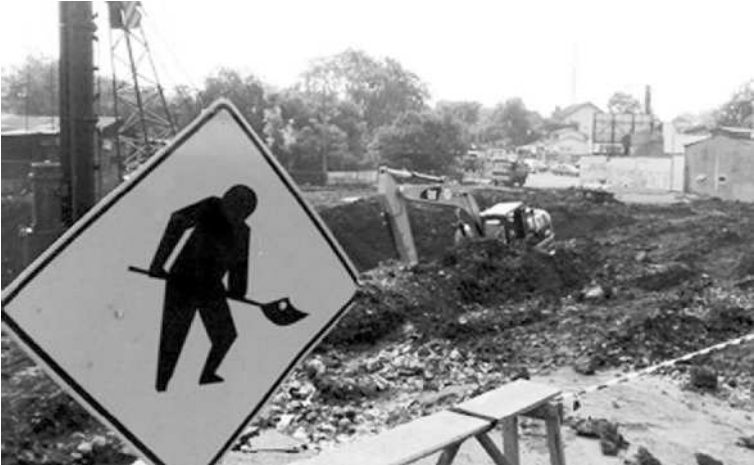
Proyek pembebasan lahan untuk pembangunan perumahan.

“Jadi, UU ini sudah sangat mendesak. Selain membebaskan lahan fasilitas umum untuk pembangunan tol, UU tersebut penting untuk mengatur pembebasan