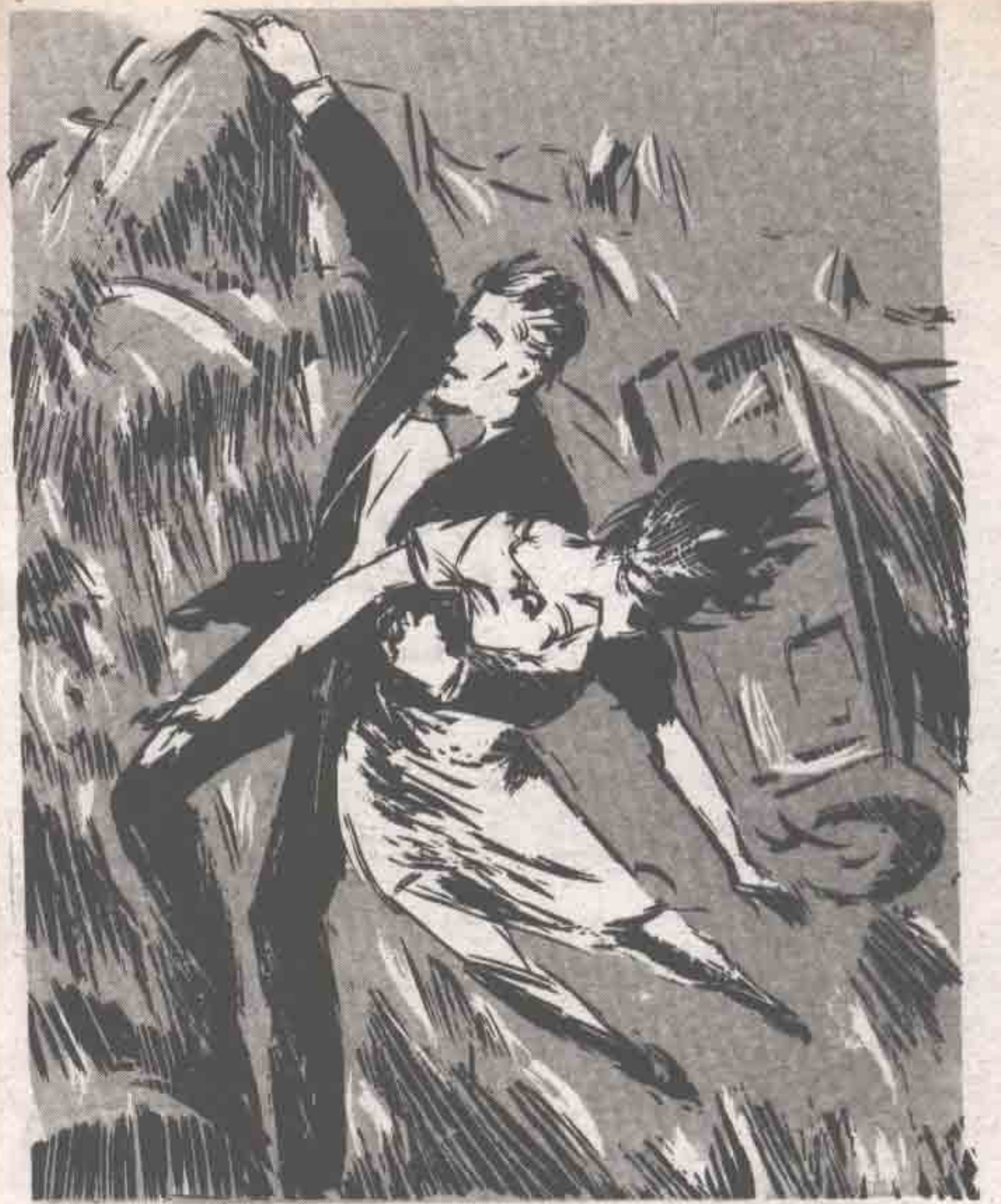
وقفز معها خارج السيارة ، التي سقطت في أعماق الهوة السحيقة ، في حين تعلّق هو بصخرة ..

قال ( أدهم ) في هدوء ، وهو ينفخ الغبار عن حُلته : — ستموتين يا ( ماريانا ) ، ولكن بحكم قضائي ، فلقد كان شقيقك الغنيّ يحفظ في طيّات ثيابه بأوراق تدينه وتدينك ، وتثبت تورطكما في عمليات قتل وتهريب مخدرات ، واختطاف ، كما تثبت تورط مأمور القسم أيضًا ، ولقد أرسلت هذه الأوراق إلى النائب العام ، ولا ريب أنه سيتخذ الإجراءات المناسبة ، لإلقاء القبض على جميع المتورّطين .