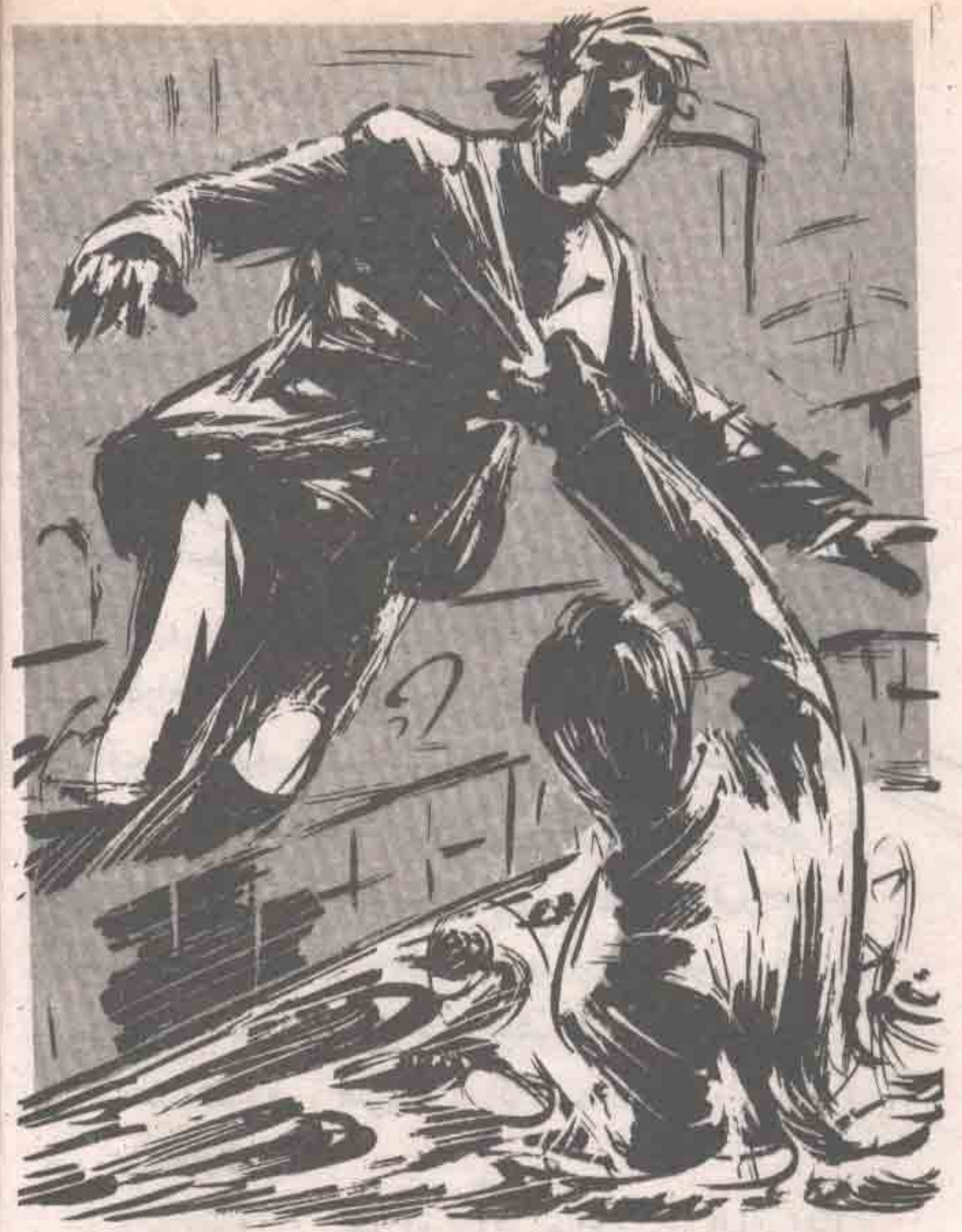
برز جسد ( أدهم ) من وسط المياه ، وقفز مخترقاً ظلمتها كشيطان مرید ، أو كشبح عاد من عالم الموتى ؛ ليقتص من قاتله ..