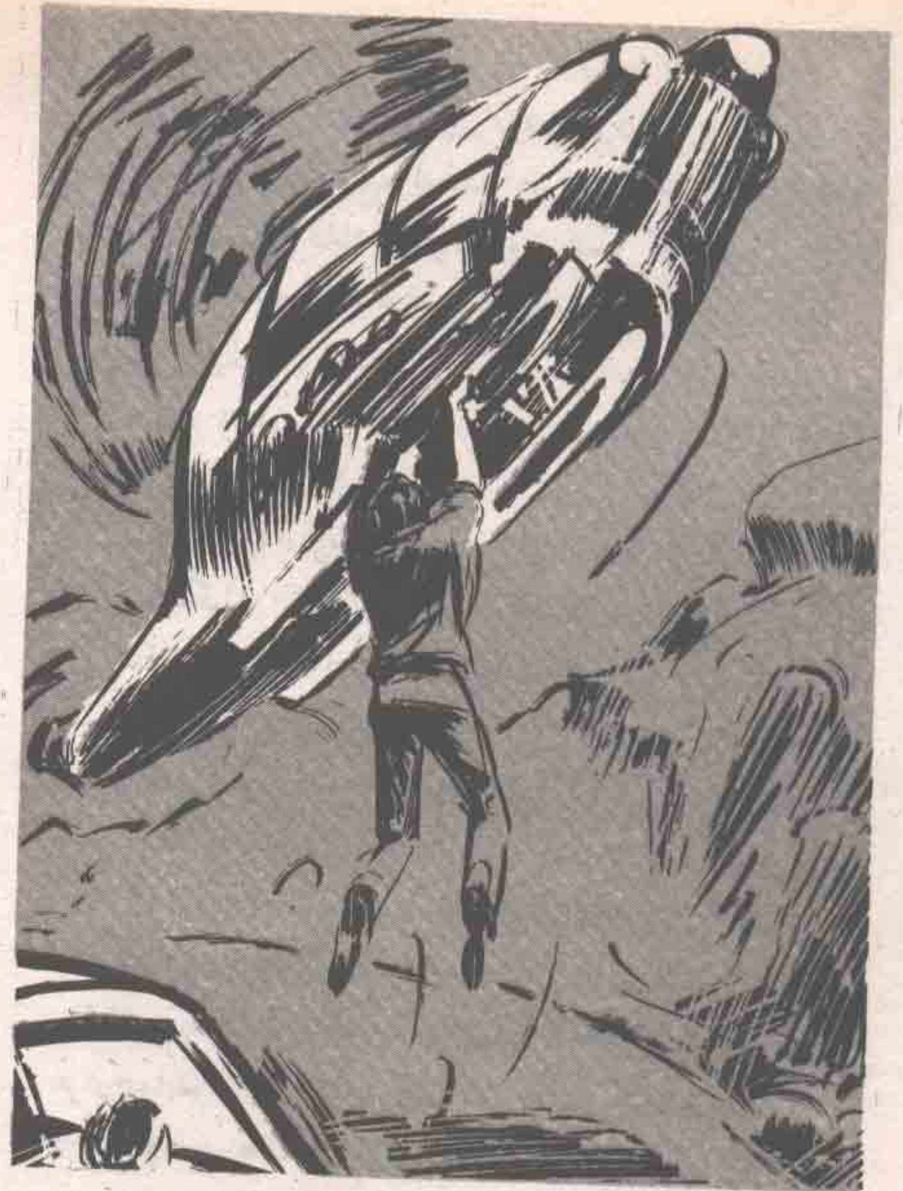
وتعلق بالهليكوبتر في مهارة مذهلة ، جعلت قائدها يفقد السيطرة عليها .